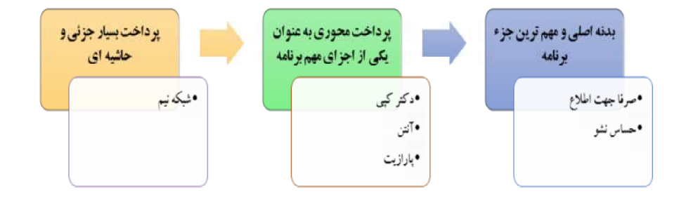
شکل ۲. وضعیت و جایگاه مرور و تفسیر خبر در برنامههای مورد بررسی

بررسی ساختاری 7 برنامه نشان میدهد که همه آنها یک یا چند بخش را برای مرور یا تفسیر خبرهای هفته در نظر گرفتهاند. با این حال تفاوتهایی میان آنها در ایـن زمینه وجود دارد.