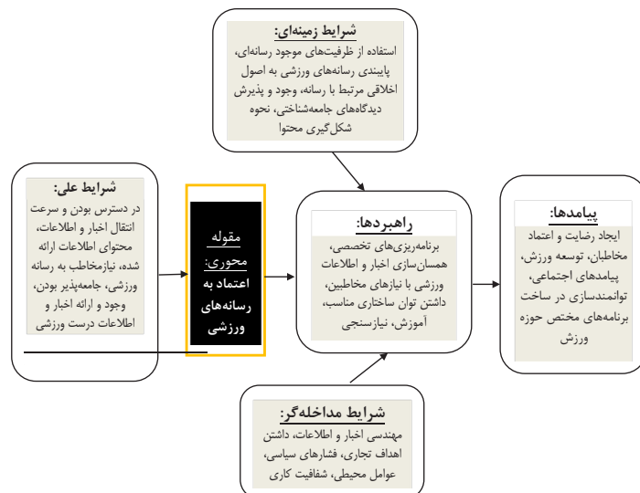
Figure 1. The final model of audience trust in a variety of sports media