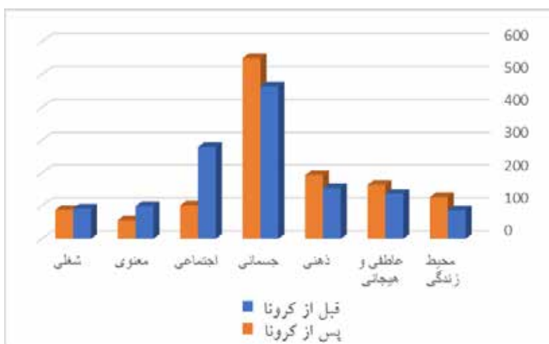
Figure 1 . Comparison of mean health dimensions of programs before and after corona outbreak